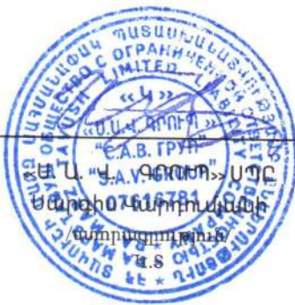
Սոնա Մարտիրոսյան /ստորագրություն/ Կ.Տ